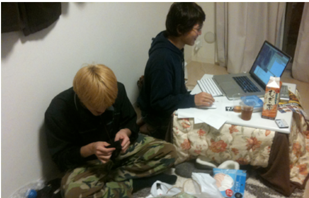
↑こたつを使った悪い例

ラップトップの前に正座して演奏するのって、なんか地味だよな。僕も「演奏しようとしたら嫌でもかっこ良くなっちゃうような」そんな楽器が欲しかったんだ。その気持ちは、民主党政権になった今でも変わらないよ。